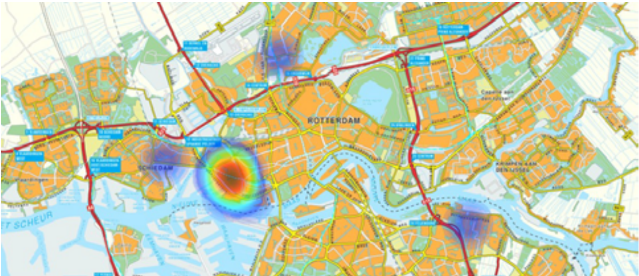
FIGUUR 2: FRAGMENT UIT DE STANDAARDRAPPORTAGE VAN DE GROEPSSCAN

Het is niet altijd nodig om alle 7 stappen voor iedere jeugdgroep te doorlopen. Wellicht blijkt na weging van de signalen dat een gerichte actie voldoende is om het probleem op te lossen. Een gezamenlijk plan van aanpak is dan niet nodig. Ook kan na het maken van een groepsduiding (zie stap 3) duidelijk worden dat de problemen niet vragen om een groepsaanpak. Vanaf dit punt kun je afschalen (stap 7) of je leidt een jongere toe naar een voorziening in het sociaal domein of een persoonsgerichte aanpak Zorg en Veiligheid (PGA Z&V).